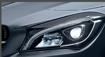
High-performance led-koplampen (632)