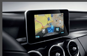
AUDIO 20 CD en Garmin® MAP PILOT navigatiesysteem (522+357)