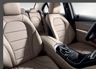
- AVANTGARDE interieur (P14) met voorstoelen in lederlook ARTICO/stof Norwich zwart (301) of kristalgrijs (318) en driespaaks multifunctioneel stuurwiel in leder zwart