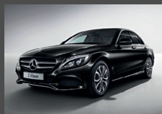
- AVANTGARDE exterieur (P15) met verlaagd AGILITY CONTROL-onderstel en 17"lichtmetalen velgen (80R/R52)