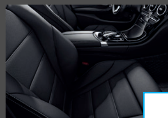
Zitcomfortpakket (P65) € 242