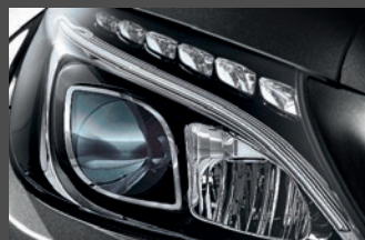
Led-koplampen high performance (632)