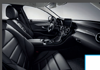
Lederen bekleding (2XX) € 1.984