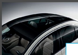
Panoramaschuifdak (413) 1) € 2.142 voor Limousine € 1.718 voor Estate