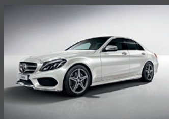
– AMG Line exterieur inclusief lager liggend sportonderstel (P31)