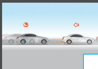
Rijassistentiepakket (23P) incl. spiegelpakket (P49) € 3.086 i.c.m. Plus pakket (DA3) € 2.541