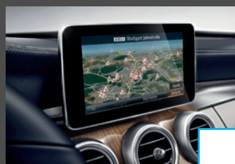
COMAND Online (531) € 2.420