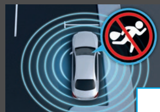
Antidiefstalpakket (P54) € 484