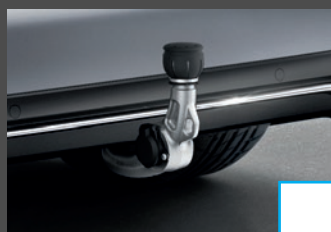
Trekhaak 1) (550) € 1.016