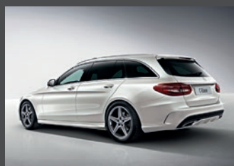
18" vijfspaaks lichtmetalen AMG velgen (782)