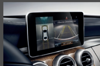
Parkeerpakket met achteruitrijcamera (P44+218)