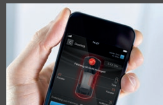
Remote online (11U)