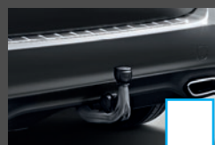
Trekhaak 3) (550) € 956