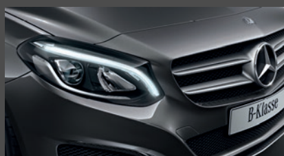
High-performance led-koplampen (632)