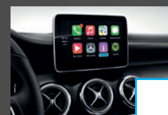
Smartphone integratie (14U) € 363