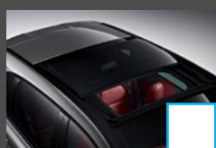
Panoramisch schuifdak 4) (413) € 1.385