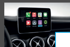
Smartphone integratie (14U) € 363