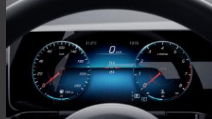
Widescreen cockpit (458)