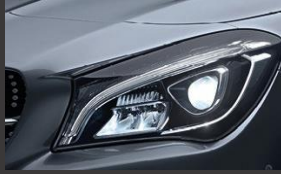
High-performance led-koplampen (632)