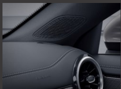
Advanced Sound System (853)