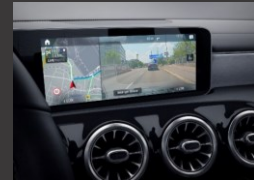
Augmented reality voor navigatie (U19)