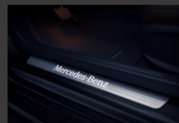
Verlichte instaplijsten (U25)