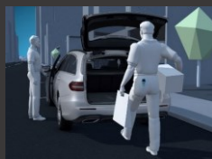
KEYLESS-GO package (P17)