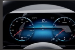
Widescreen cockpit (458)