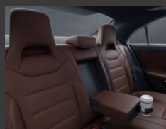
Armsteun achter (400)