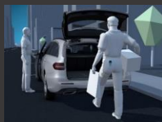
KEYLESS-GO package (P17)