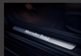
Verlichte instaplijsten (U25)